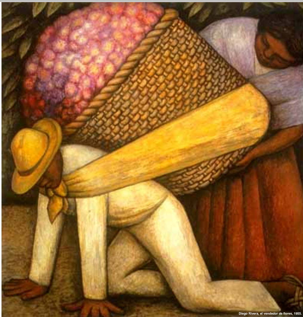
Diego Rivera, el vendedor de flores, 1955.

Soluciones diseñadas para sus transacciones comerciales internacionales