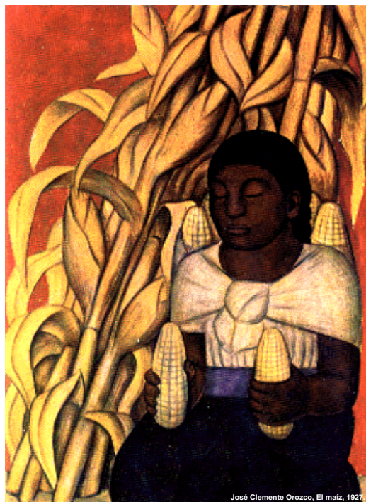
José Clemente Orozco, El maíz, 1927

cumplen con la obligación de llevar un control de inventarios en forma automatizada, cuando lleven un sistema de control de inventarios que contengan al menos los catálogos y módulos establecidos en el Anexo 24, rubro C de la presente Resolución (reforma a la Regla 3.3.3.).