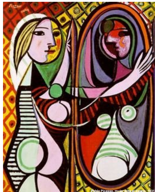
Pablo Picasso, mujer ante el espejo, 1931.

En ningún caso se considerarán mercancías a granel, las mercancías de difícil identificación que por su presentación en forma de polvos, líquidos o gases requiera de análisis físicos y/o químicos para conocer su composición, naturaleza, origen y de-